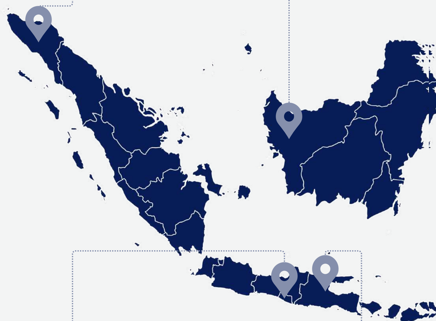
Kantor Panewu Gamping 07°47'43.91" S 110°19'18.36" T