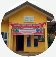
Kantor Reje Tanoh Abu 04°27'08.44" U 096°48'29.15" T