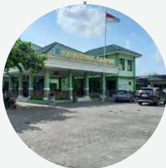
Kantor Panewu Gamping 07°47'43.91" S 110°19'18.36" T